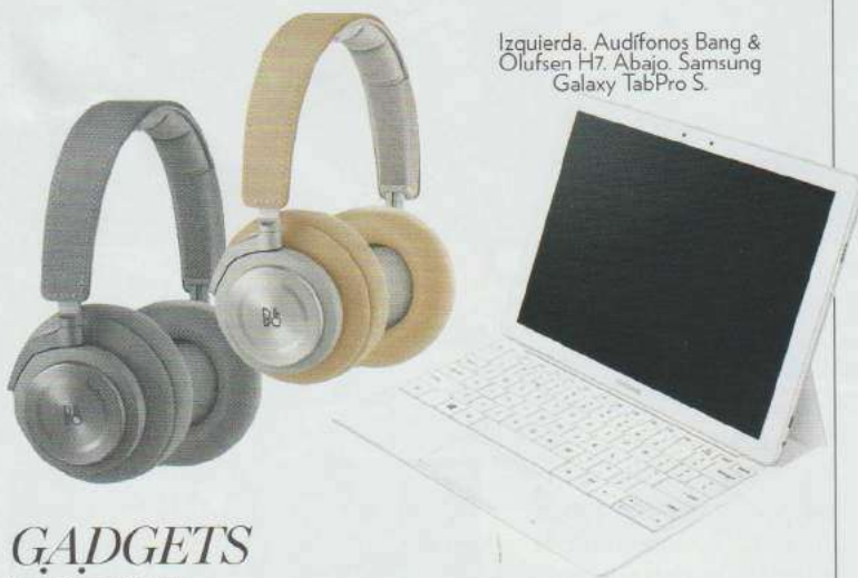
Izquierda, Audífonos Bang & Olufsen H7. Abajo, Samsung Galaxy TabPro S.

Cosas que debes saber sobre el mundo del interiorismo, viajes y tecnología.