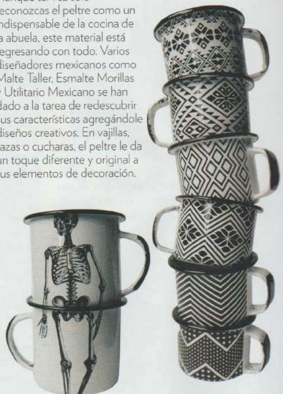
Tazas de peltre, de Malte Taller.

Aunque tal vez sólo reconozcas el peltre como un indispensable de la cocina de la abuela, este material está regresando con todo. Varios diseñadores mexicanos como Malte Taller, Esmalte Morillas y Utilitario Mexicano se han dado a la tarea de redescubrir sus características agregándoles diseños creativos. En vajillas, tazas o cucharas, el peltre le da un toque diferente y original a tus elementos de decoración.